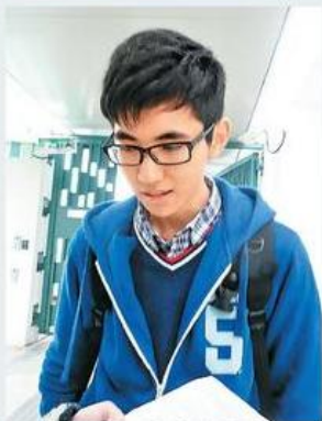
■陳同學覺得政治題目比較難。