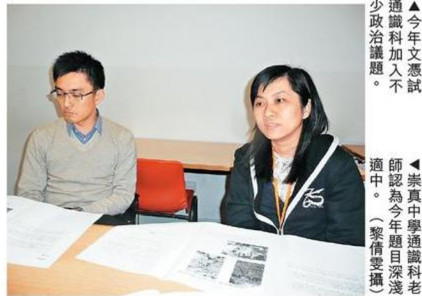
▲今年文憑試通識科加入不少政治議題。