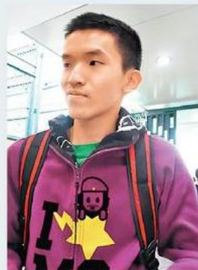
■黃同學考完後，同樣覺得政治題目難答。