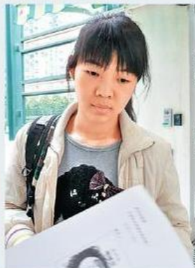
■鍾同學認為卷一立法會「拉布」題容易。