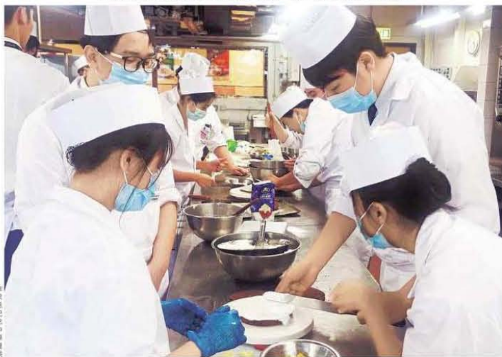
西式食品製作是最受歡迎的應用學習課程，每年有逾700人選擇修讀。

經濟轉型，年輕人除了要有學歷，也需要有技能知識，才能軟、硬並重。教育局設有應用學習課程，歷年修讀人數偏少，證明存在深層問題，而將課程與文憑試脫鉤，才能鼓勵更多學生修讀，達致讓學生及早了解自己志向的效果。