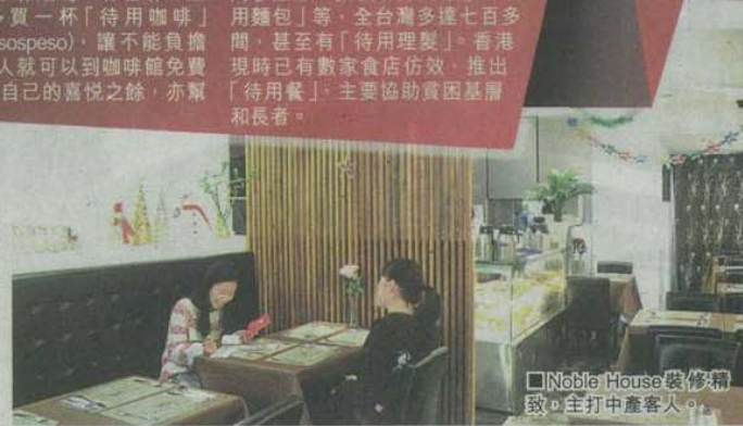
■Noble House裝修精緻，主打中產客人。

這社會資源的簡單再分配「待用」概念一度沒落，但近年吹到亞洲，台灣有不少食肆發揮這「待用」觀念，推出「待用飯」、「待用麵包」等，全台灣多達七百多間，甚至有「待用髮型」。香港現時已有數家食店仿效，推出「待用餐」，主要協助貧困基層和長者。