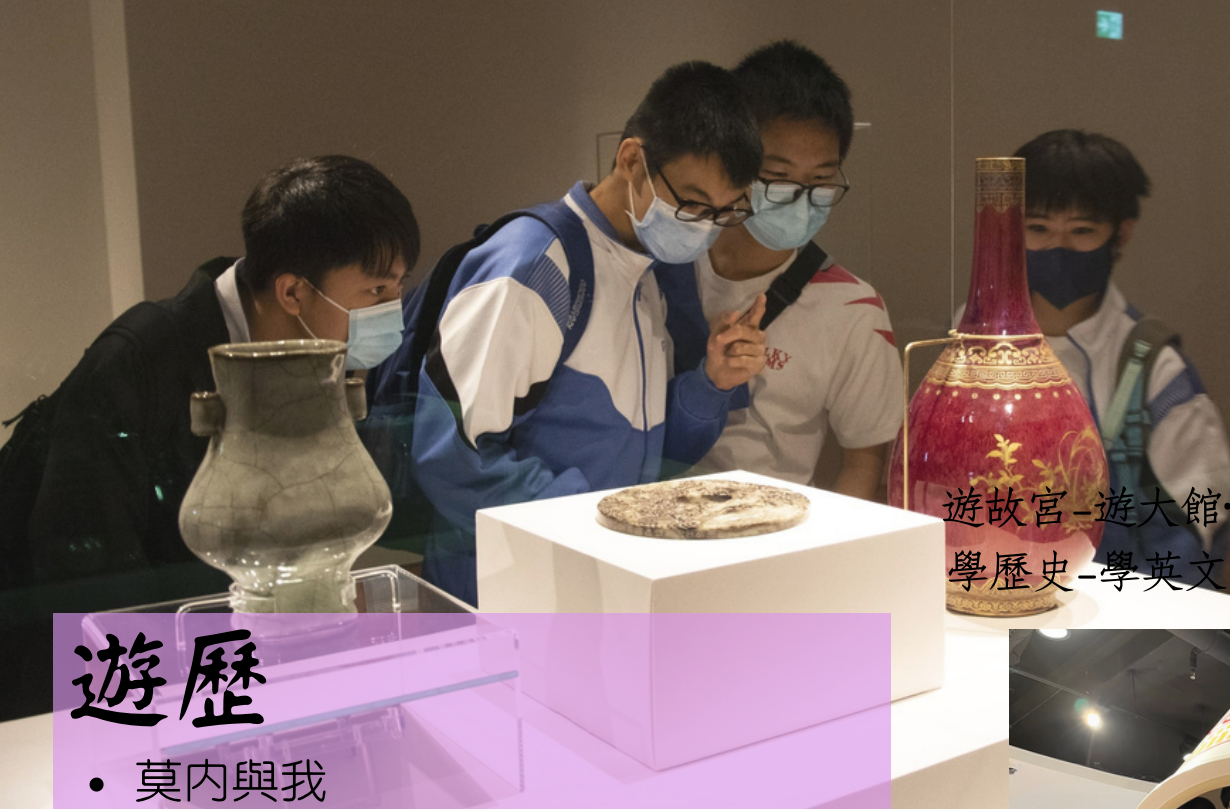
遊故宮-遊大館· 學歷史-學英文